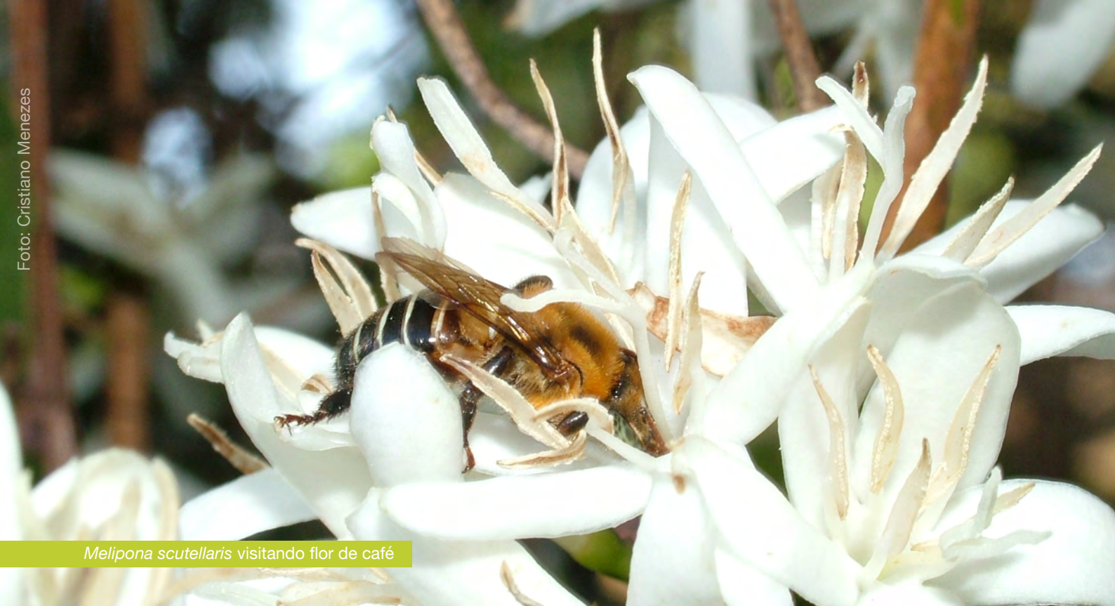
Melipona scutellaris visitando flor de café

do nosso suprimento alimentar. O benefício da polinização é traduzido em frutos maiores, mais pesados, com maior número de sementes, mais vistosos, agregando maior valor de mercado, ou seja, a polinização realizada de forma gratuita pelos animais é convertida em lucro direto ao agricultor.