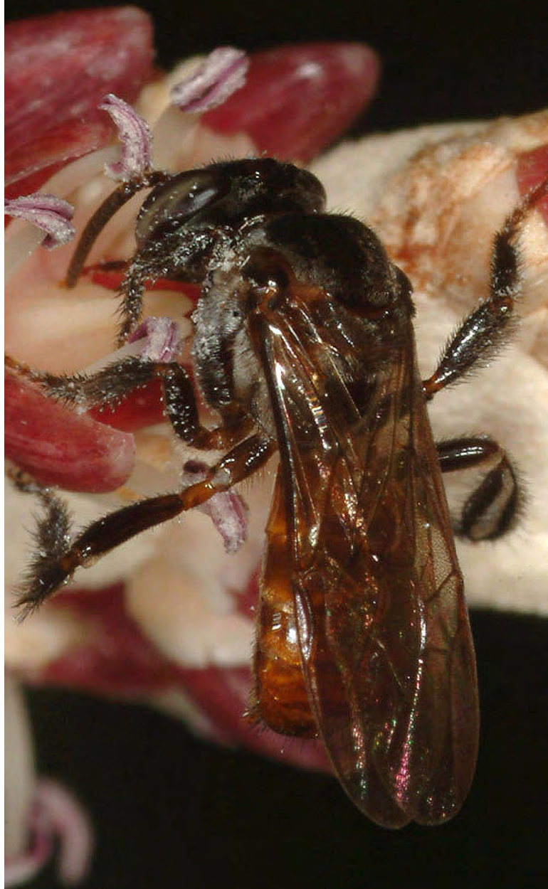
Trigona fulviventris na flor de açai