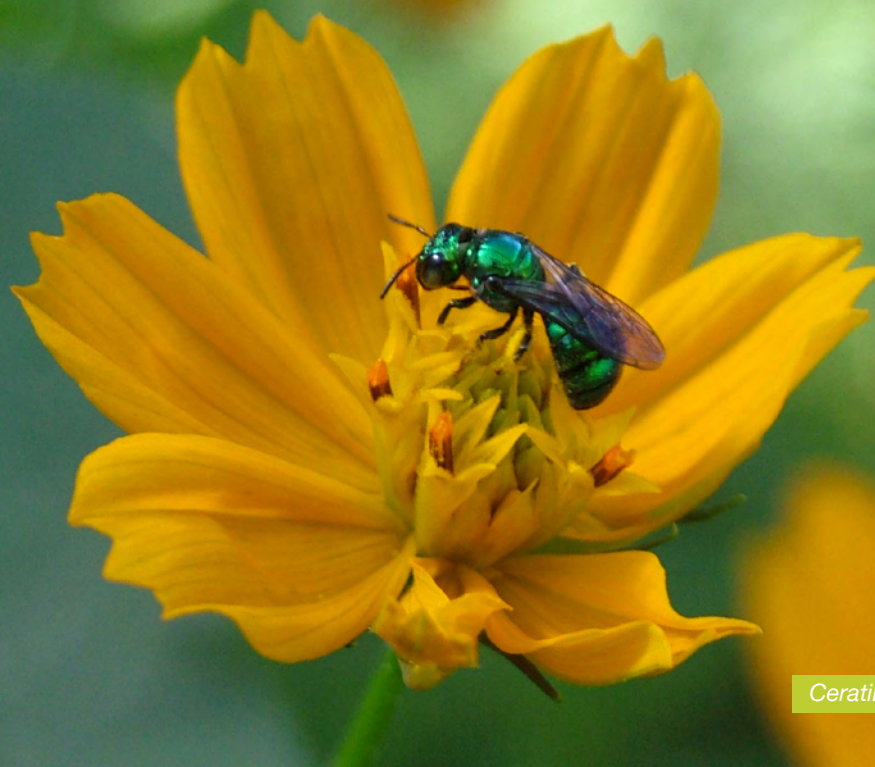
Ceratina sp. visitando flor de cosmos

ser indivíduos que saem para forragear para distâncias incomuns à sua rotina, ou fazem parte de populações reduzidas que persistem dentro dos campos agrícolas.