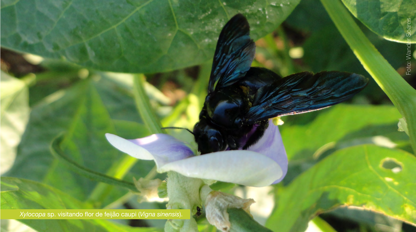
Xylocopa sp. visitando flor de feijão caupi ( Vigna sinensis ).

por recursos florais muitos deles conseguem alcançar seus alvos sem polinizar as flores. Isso pode ocorrer por uma série de motivos, desde o tamanho inapropriado do visitante em relação à flor, até o seu comportamento dentro desta ou o horário da visita.