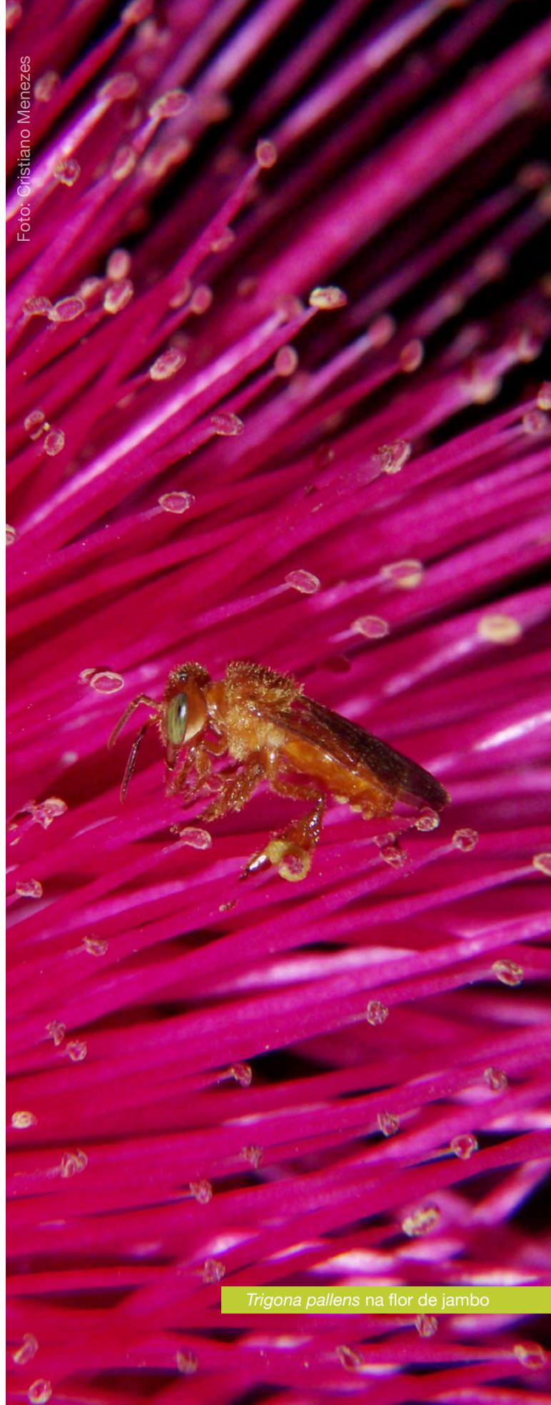
Trigona pallens na flor de jambo