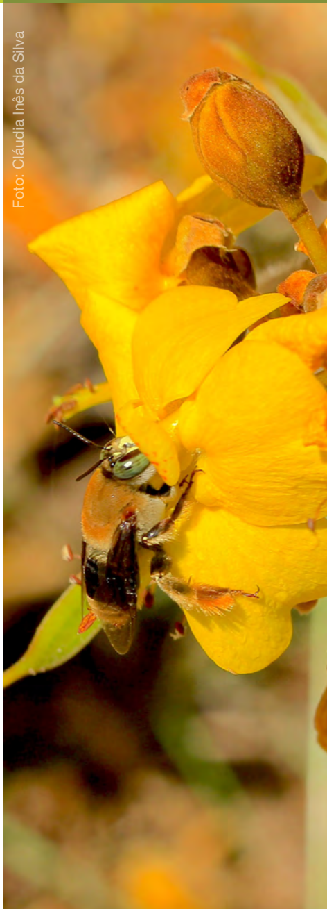
Macho de Centris sp. visitando flor de Poincionella gardneriana (Leguminosae).

A preocupação com o destino do planeta e principalmente de nosso País é pauta diária de todos os cidadãos.