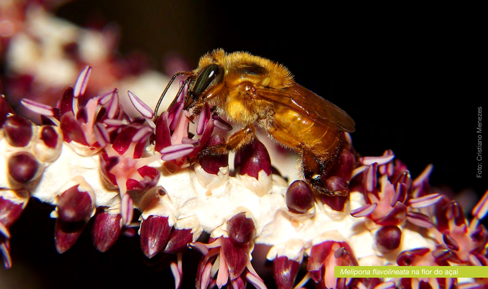
Melipona flavolineata na flor do açáí