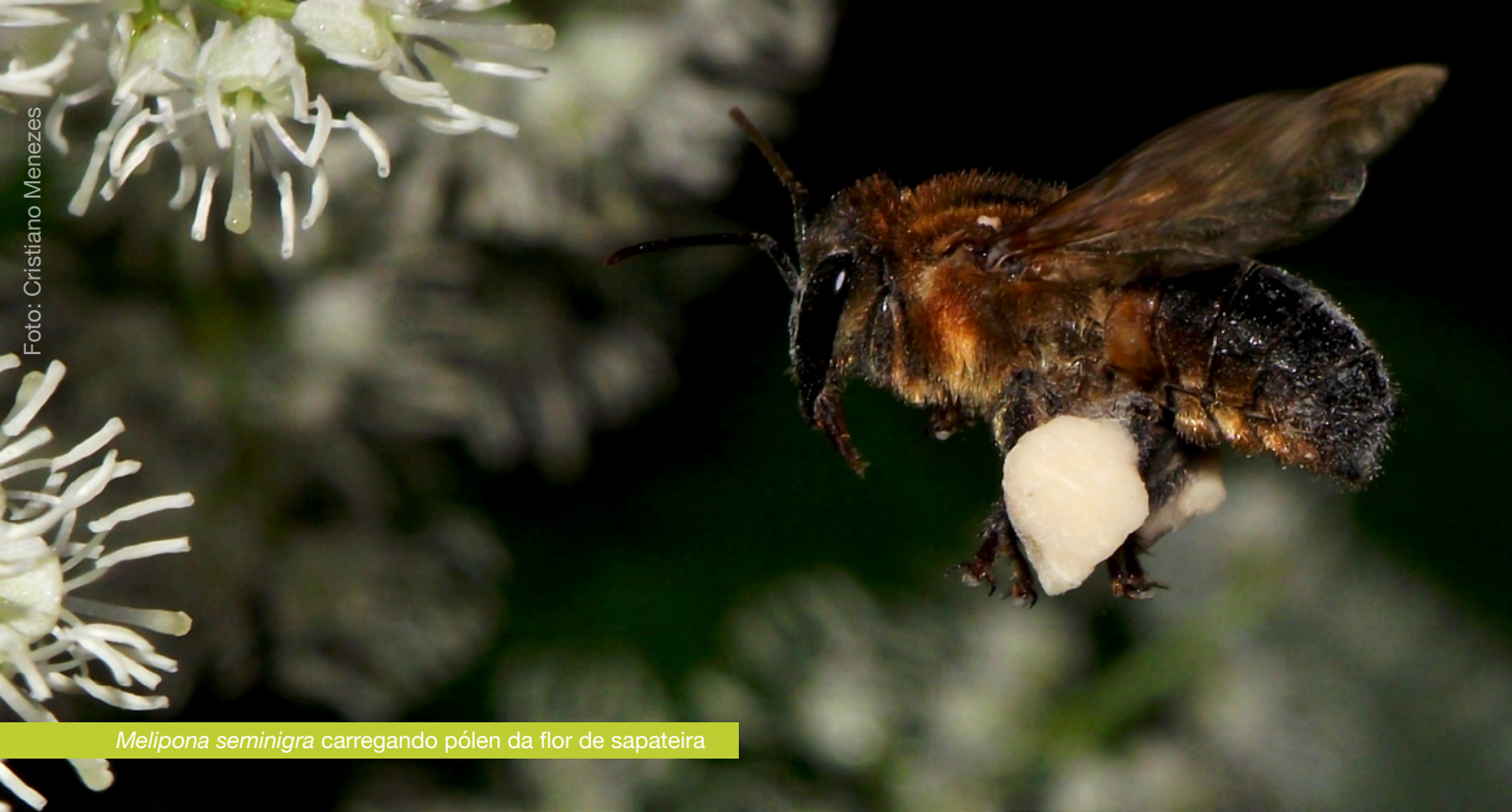
Melipona seminigra carregando pólen da flor de sapateira

2) A diversidade de visitantes florais, a taxa de visitação dos polinizadores às flores e a produtividade agrícola são afetadas negativamente pelo aumento do grau de isolamento de habitats (semi-)naturais das áreas agrícolas. Ou seja, quanto maior a distância entre os habitats e as lavouras, maior o declínio do número de espécies de polinizadores e de suas visitas às flores das culturas, acarretando prejuízos à produtividade agrícola.